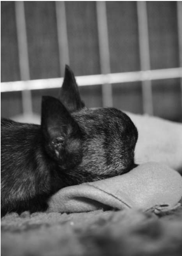
Verenpurkauma näkyi suurena pattina useamman viikon.

Ennen lähtöä otettiin vielä röntgenkuva päästä, jossa ei näkynyt murtumia, ainoastaan valtava sisäinen vuoto, josta pään turpoaminen johtui.