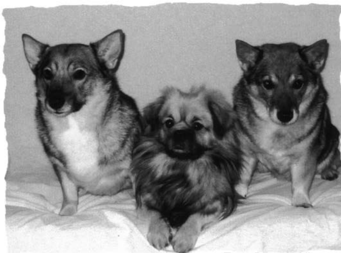
Taru, Repe ja Ulpu