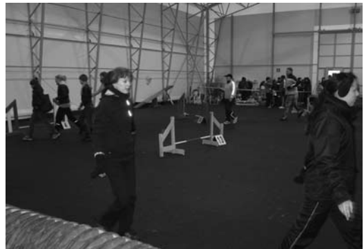
Tallin ensimmäisen kisan ensimmäinen ryhmä eli mini ja medi mölliohjaajat rataantutustumassa