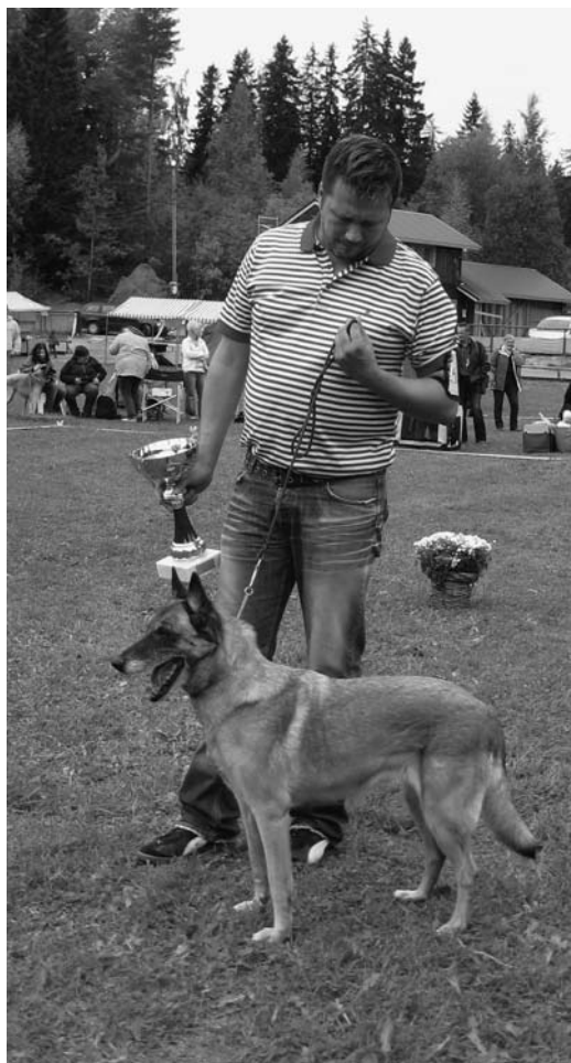
Pohjois-Hämeen Kennelpiirin palkinto, näyttelyn vanhimmalle koiralle.