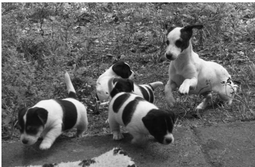
Puolivuotias Rinkula toimi toukokuussa 2007 syntyneiden jackrussellipentujen leikitätinä.

Pentu-Rinkula oli siis tullut Englannista asianmukaisesti eläinlääkärin tarkistamana lemmikkipassin kera (karvojen puuttuminen oli tässä vaiheessa enää kosmeettinen ongelma, jonka aika korjasi). Sen kasvattaja oli kuljettanut sen lentokentälle, josta pennun kannalta pitkä matka Suomeen sitten alkoi. Aina englantilaiset jackrussell-kasvattajat eivät näin avuliaita, vaan pennun voi joutua paitsi hakemaan, myös käyttämään Englannissa itse eläinlääkärillä terveystarkastuksessa