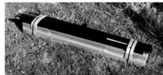
Hyppyeste on kasattuna näin pieni.