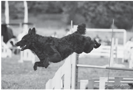
MAXI-koira, kulta.