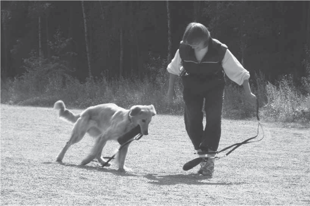
Patukkaa voi myös vetää perässään narussa. Herillä ei ole aikomustakaan luopua edellisestä patukastaan Lillin leikkiessä yksin.

Patukka on tässä leikissä se saalis. Saaliin pitää liikkua maata pitkin. Saalis ei myöskään koskaan pysähdy. Patukoita pitää olla leikissä kaksi samanlaista. Ensimmäinen patukka heitetään maata pitkin vasemmalle. Kun koira on ottanut patukan suuhunsa, ohjaaja heiluttelee toista patukkaa, jolloin ”saalis” liikkuu taas ja saa koiran huomion. Liikkumattoman patukan koira pudottaa ja ryntää ohjaajan liikkuvan