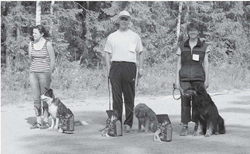
Erikoisvoittajaluokka.