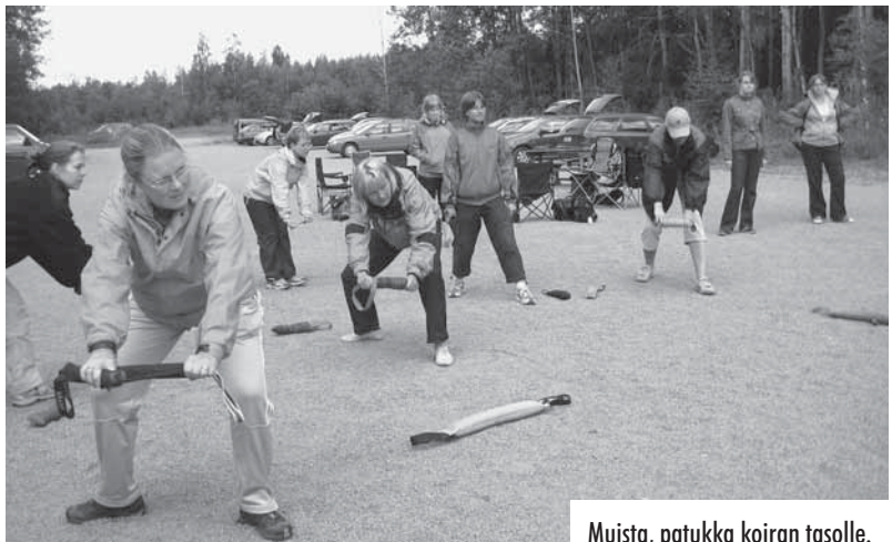
Muista, patukka koiran tasolle.

Koko porukka veti perässään patukoita ja heitteli niitä ympäri kenttää. Juostiin niiden perässä ja taas heiteltiin ja taas juostiin. Koirat