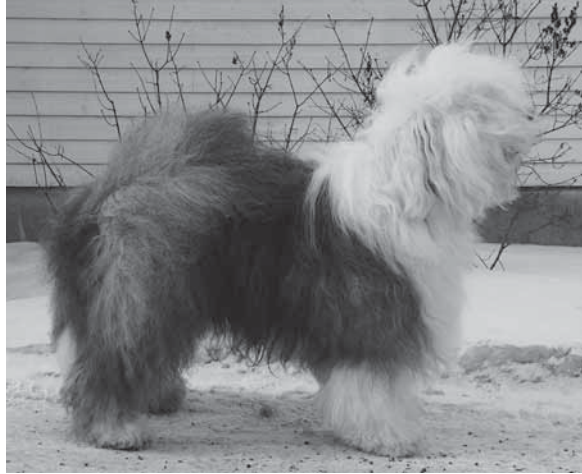
vanhaenglanninlammaskoira Fin mva

Grey Coats D'm so Tip-Top "Eddie" (2004-2008)