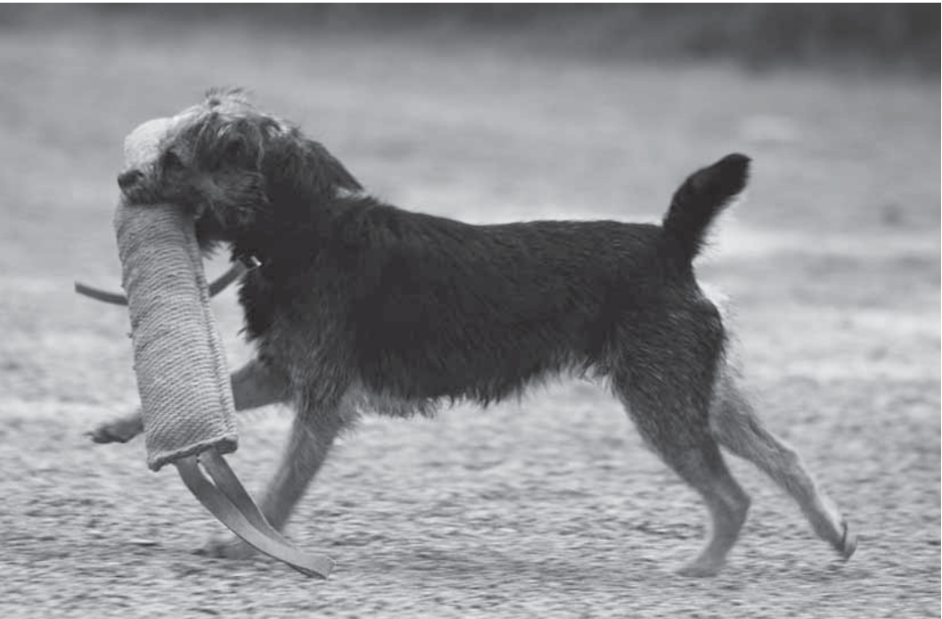
Pyritään siihen, että koira saa ylpeänä kantaa saalista ohjaajan kehumana. Onnistuneet leikit kasvattavat koiran itseluottamusta ja luovat hyvää suhdetta koiran ja ohjaajan välille.

Seurakoiralla nämä samat ominaisuudet ja niiden ilmentymät saatetaan kokea jopa erittäin negatiivisiksi luonteenpiirteiksi, sillä tarkkas ja touhukas koira vaatii omistajaltaan jaksamista suunnata koiran energiaa johonkin hyödylliseen tekemiseen. Ellei näin menetellä, on kotona pieni koirariiviö, joka saattaa omaloitteisesti tuhota kodin irtaimistoa ja häiritä isäntäväkeään.