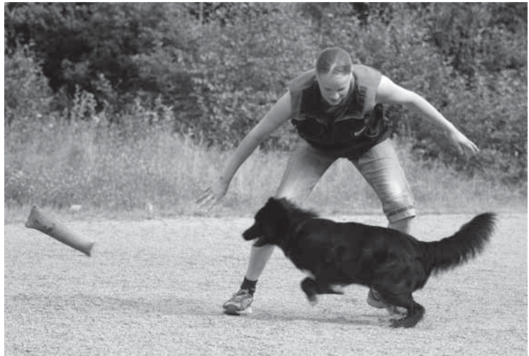
Kun nähdään, että koira on ottanut suuhunsa heitetyn esineen, otetaan esille toinen samanlainen patukka ja tehdään sillä saalisärsykeitä. Tällöin koira tiputtaa suussaan olevan patukan ja alkaa saalistaa "liikkuvaa" patukkaa. Sama kuvio toistetaan toiseen suuntaan. Rytmikkäästi ja mukana eläen.

On koirakohtaista, kuinka pitkään peliä voi, tai kannattaa, jatkaa. Useimmiten sopivan rytmikäs, sujuva ja hyvällä halulla tehty 5–10 heittoa lienee riittävä määrä.