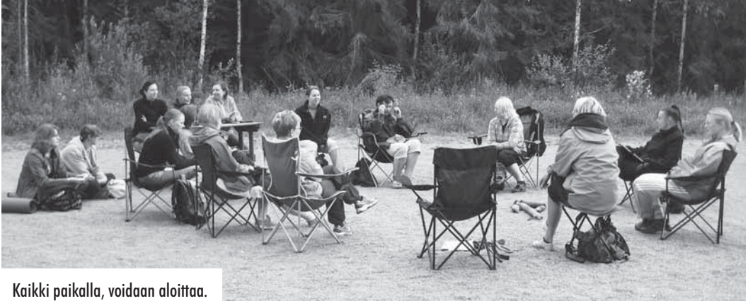
Kaikki paikalla, voidaan aloittaa.

Lauantaina klo 9.30 kokoontui 15 kurssilaista Niihamaan, luvassa oli kurssi saalisvietin käytöstä.