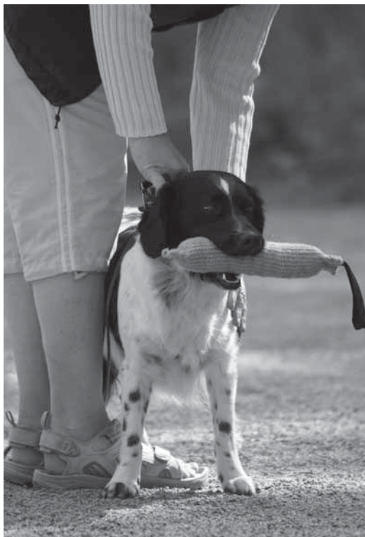
Lopuksi koiraa otetaan pannasta kiinni ja silitellään matalalla äänellä kehuun, kunnes se itse tiputtaa saaliin. Koira jää levolliseen ja rauhalliseen tilaan.