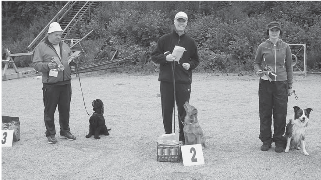
Yllä erikoisvoittajaluokka, alla TamSK:n voittojoukkue.