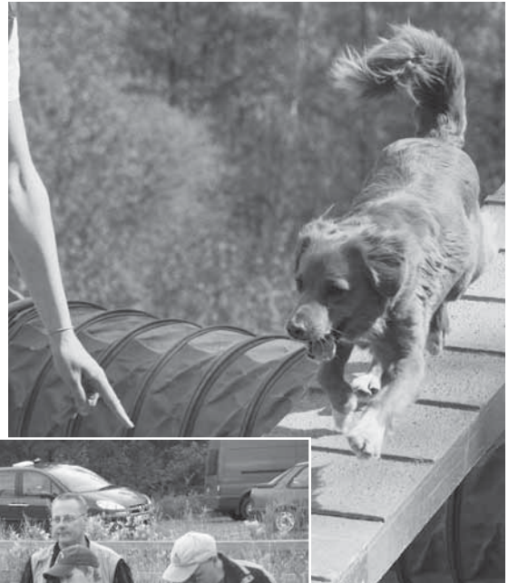
MEDI-koira, kulta.