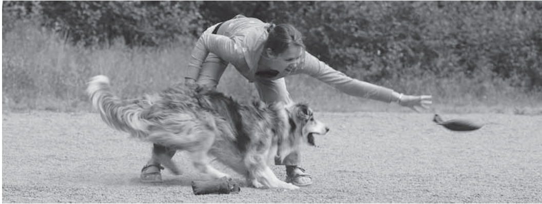
Kun koiran halu tarttua esineeseen on suurimmillaan, patukka heitetään useiden metrien päähän ohjaajasta.

Saalisviettä hyväksikäyttäen voimme myös ajautua sellaiseen häiriötilanteeseen, jossa koira katsoo tarpeelliseksi puolustaa