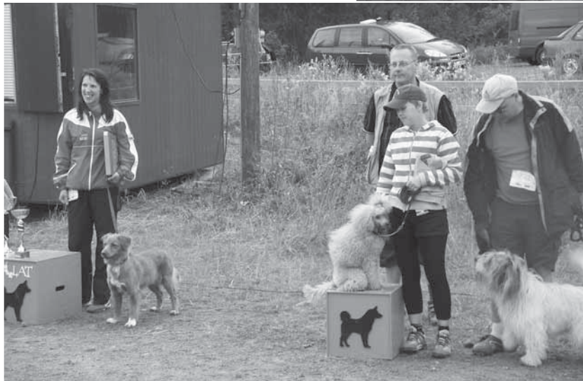
Kuvassa MEDI-koirat, kulta, hopea, pronssi.